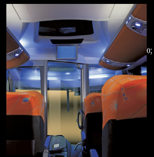
Nuevo ambiente interno más amplio, proporcionando mayor bienestar.

¡Nosotros tenemos la solución adecuada para sus requerimientos!