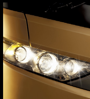
Conjunto óptico innovador en leds.